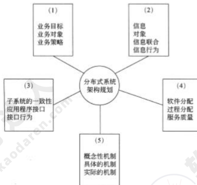
图 2-1 ODP 架构视点示意图

ODP 从 5 个标准的视点组织分析系统的架构，这些视点描述了同一系统的不同重要方面，请根据图 2-1 中不同视点所关注的核心内容，将备选的架构视点填入图中的 (1)~(5)。